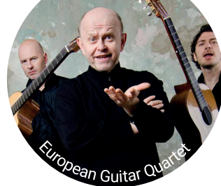
European Guitar Quartet